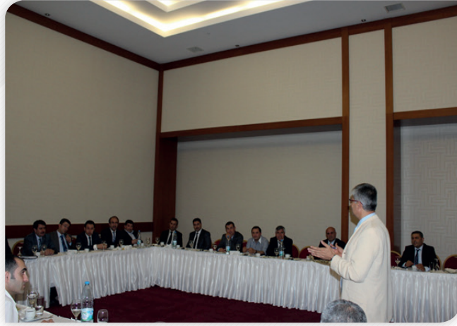
Kalkınma Kurulu Bölge Planı İstişare Toplantısı – 14 Haziran 2013, MALATYA