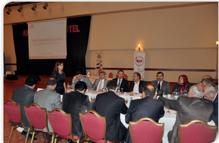
Onuncu Kalkınma Planı ve Bölgesel Öncelikler Çalıştayı Grup Çalışmaları – 11 Ekim 2012, ELAZIĞ