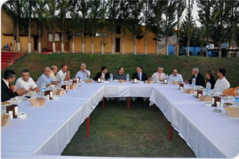
Kalkınma Kurulu Malatya Üyeleri İstişare Toplantısı – 6 Ağustos 2011, MALATYA

Bu dönemde kalkınma kurulu üyeleri ve diğer yerel aktörler arasında işbirliğinin artırılması ve bölge sorunları konusunda farkındalık oluşturulmasına yönelik 4 ilden kalkınma kurulu üyelerinin katılımıyla çok sayıda forum, çalıştay, panel vb. organizasyon gerçekleştirilmiştir.