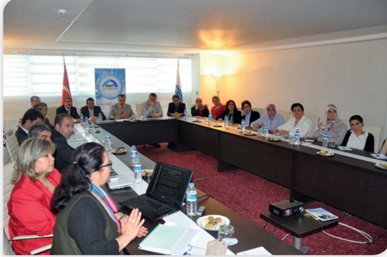
TRB1 Bölgesi "Kadın Dostu Kentler" Çalıştayı – 12 Nisan 2012, MALATYA

Kalkınma Kurulu Turizm Komisyonu üyeleri ve diğer ilgililerin katılımıyla 3 Temmuz 2012 tarihinde Tunceli'de "TRB1 Bölgesi Sürdürülebilir Turizm Stratejisi ve Eylem Planı" temalı diğer bir çalıştay gerçekleştirilmiştir.