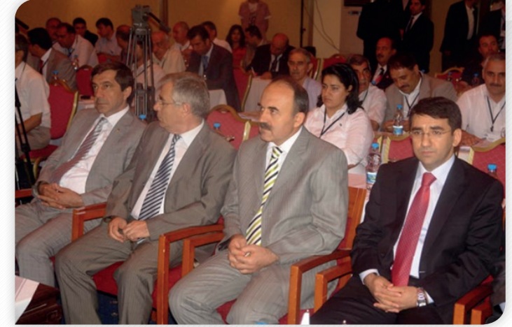
Kalkınma Kurulu 2010 yılı 1. Olağan Toplantısı - 22 Temmuz 2010, ELAZIĞ