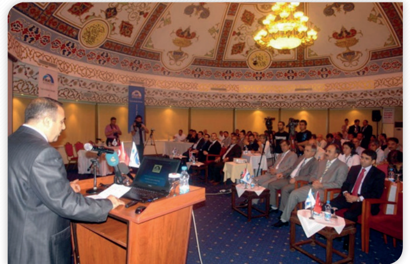
Kalkınma Kurulu 2010 yılı 1. Olağan Toplantısı Açılış Konuşması - 22 Temmuz 2010, ELAZIĞ

alanlarında beş komisyon oluşturulmuştur.