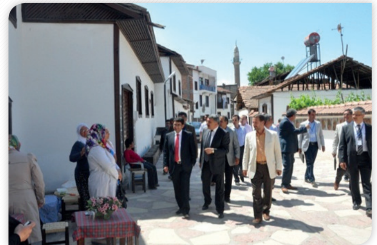
2012 yılı Birinci Olağan Kalkınma Kurulu Toplantısı – Battalgazi Gezisi

12 Nisan 2012'de Kalkınma Kurulu Sosyal Komisyonu üyeleri ve diğer ilgililerin katılımıyla "Kadın Dostu Kentler" konulu bir çalıştay gerçekleştirilmiş ortaya çıkan görüş, düşünce ve öneriler ilgili mercilere ulaştırılmıştır.