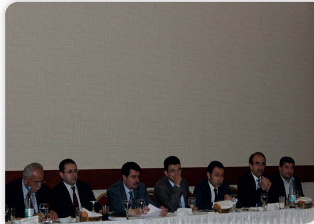
Kalkınma Kurulu Bölge Planı İstişare Toplantısı – 14 Haziran 2013, MALATYA