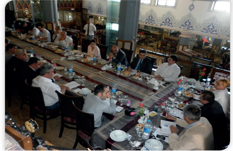
Kalkınma Kurulu Bölge Planı İstişare Toplantısı – 13 Haziran 2013, ELAZIĞ

13 Haziran 2013 tarihinde Elazığ Osmanlı Mutfağı'nda gerçekleştirilen Kalkınma Kurulu İstişare Toplantısı'na Kalkınma Kurulu Elazığ üyelerinin yanı sıra Kalkınma Ajansı Yönetim Kurulu Üyelerinden Elazığ Valisi Muammer Erol ve Elazığ Belediye Başkanı Süleyman Selmanoğlu da katılım sağlamışlardır. Toplantıda 2014-2023 TRB1 Bölge Planı Taslağı Elazığ özelinde değerlendirilmiştir.