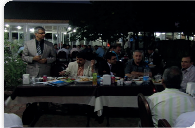
Kalkınma Kurulu Bingöl Üyeleri İstişare Toplantısı 8 Ağustos 2011, BİNGÖL

Yine bu dönemde Malatya, Elazığ, Tunceli ve Bingöl illerinde Ajans Yönetim Kurulu üyeleri, Kalkınma Kurulu üyeleri ve diğer yerel aktörlerle tanışmak, illerimiz ve bölgenin sorunları hakkında istişarelerde bulunmak ve yapılacak şeylere beraberce karar vermek amacıyla 100'ü aşkın ziyaret gerçekleştirilmiştir