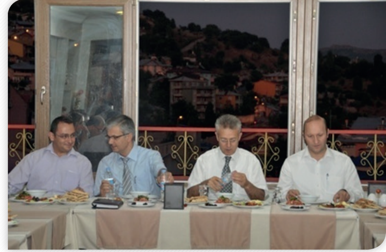
Kalkınma Kurulu Tunceli Üyeleri İstişare Toplantısı 7 Ağustos 2011, TUNCELİ

İllerde üyelerin katılımı ile istişare toplantıları gerçekleştirilmiş, her bir il özelinde o ili temsil eden kurul üyeleri ile bir araya gelinen yemekli toplantılarda ilin sorunları, potansiyeli, Ajans çalışmaları ve geleceğe yönelik öneriler değerlendirilmiştir.