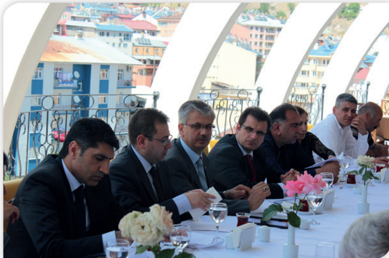
Kalkınma Kurulu Bölge Planı İstişare Toplantısı – 11 Haziran 2013, TUNCELI

13 Haziran 2013 tarihinde Elazığ Osmanlı Mutfağı'nda gerçekleştirilen Kalkınma Kurulu İstişare Toplantısı'na Kalkınma Kurulu Elazığ üyelerinin yanı sıra Kalkınma Ajansı Yönetim Kurulu Üyelerinden Elazığ Valisi Muammer Erol ve Elazığ Belediye Başkanı Süleyman Selmanoğlu da katılım sağlamışlardır. Toplantıda 2014-2023 TRB1 Bölge Planı Taslağı Elazığ özelinde değerlendirilmiştir.