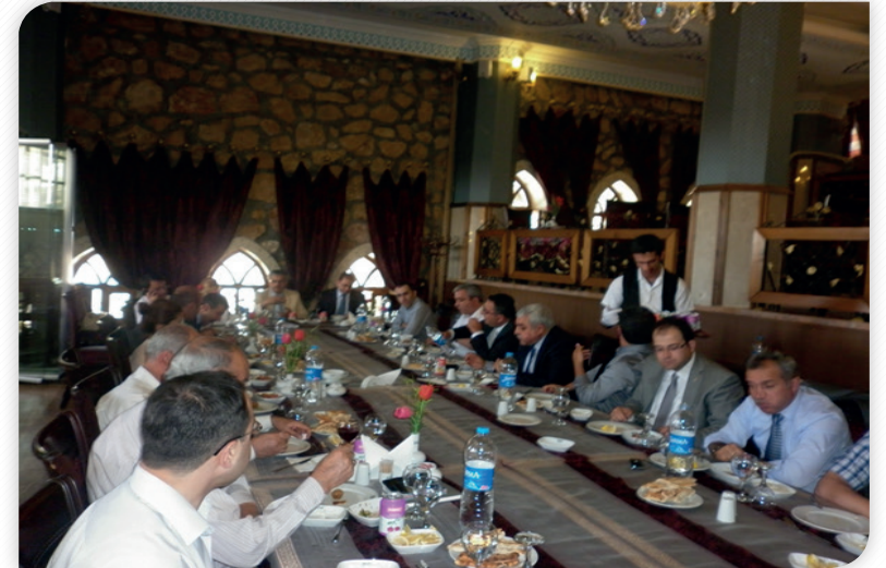
Kalkınma Kurulu Bölge Planı İstişare Toplantısı – 13 Haziran 2013, ELAZIĞ

14 Haziran 2013 tarihinde Malatya Anemon Otel'de gerçekleştirilen Kalkınma Kurulu İstişare Toplantısı'na Kalkınma Kurulu Malatya üyelerinin yanı sıra Kalkınma Ajansı Yönetim Kurulu Üyelerinden Malatya Valisi Vasip Şahin de katılım sağlamışlardır. Toplantıda 2014-2023 TRB1 Bölge Planı Taslağı Malatya özelinde değerlendirilmiştir.