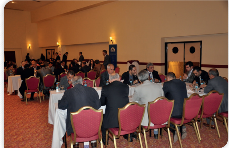
Onuncu Kalkınma Planı ve Bölgesel Öncelikler Çalıştayı Grup Çalışmaları – 11 Ekim 2012, ELAZIĞ