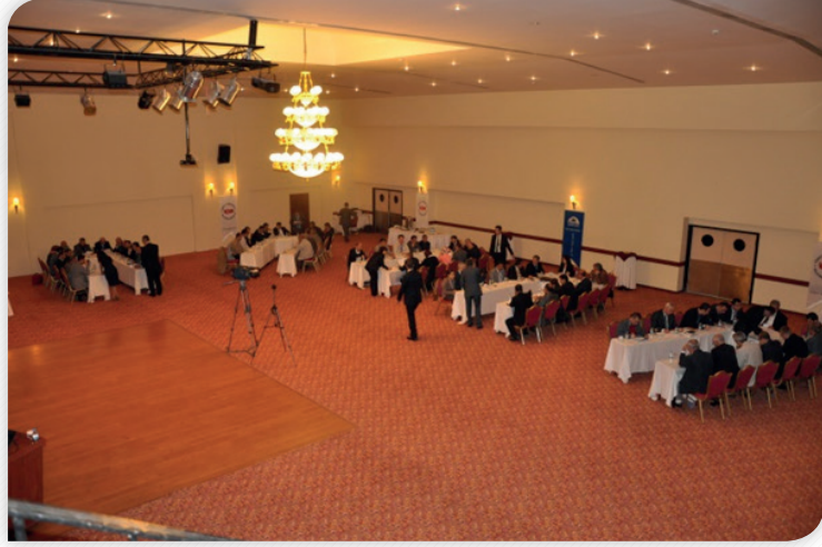
2012 Yılı İkinci Olağan Kalkınma Kurulu Toplantısı ve 10. Kalkınma Planı Çalıştayı – 11 Ekim 2012, ELAZIĞ