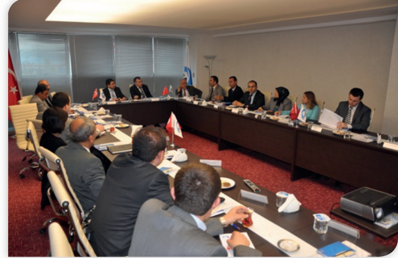
Kalkınma Kurulu Sanayi ve Ticaret Komisyonu Toplantısı 6 Nisan 2011, MALATYA