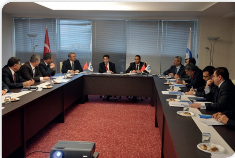
Kalkınma Kurulu Turizm İhtisas Komisyonu Toplantısı 4 Nisan 2011, MALATYA

olmak üzere gerçekleştirilen toplantılarda 2011 yılı içinde bu alanlarda çıkılması planlanan teklif çağrılarının altyapısı oluşturulmuş ve mali destek programlarının öncelik alanları ve başvuru koşulları hakkında görüşler alınmıştır.