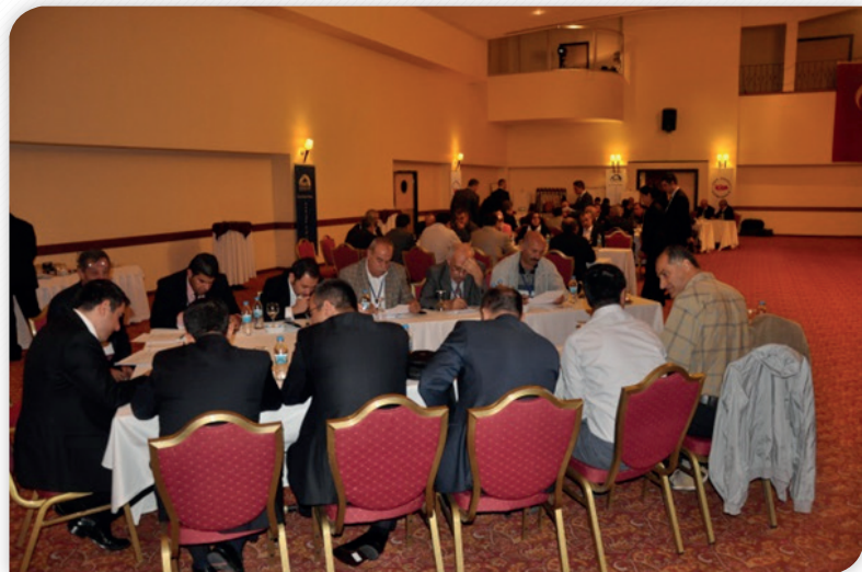
Onuncu Kalkınma Planı ve Bölgesel Öncelikler Çalıştayı Grup Çalışmaları – 11 Ekim 2012, ELAZIĞ