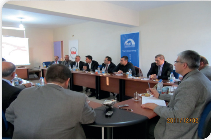
"Bölgenin Depremselliği ve Alınacak Tedbirler" Çalıştayı 1 Aralık 2011, BİNGÖL