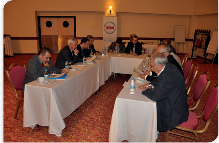
Onuncu Kalkınma Planı ve Bölgesel Öncelikler Çalıştayı Grup Çalışmaları – 11 Ekim 2012, ELAZIĞ