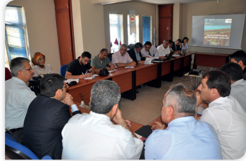
"TRB1 Bitkisel Üretim Sektörü Stratejisi ve Eylem Planı" Çalıştayı – 4 Temmuz 2012, BİNGÖL

Kalkınma Kurulu Turizm Komisyonu üyeleri ve diğer ilgililerin katılımıyla 3 Temmuz 2012 tarihinde Tunceli'de "TRB1 Bölgesi Sürdürülebilir Turizm Stratejisi ve Eylem Planı" temalı diğer bir çalıştay gerçekleştirilmiştir.