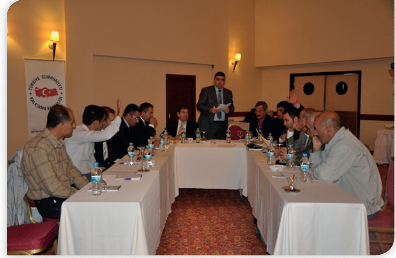
Onuncu Kalkınma Planı ve Bölgesel Öncelikler Çalıştayı Grup Çalışmaları – 11 Ekim 2012, ELAZIĞ