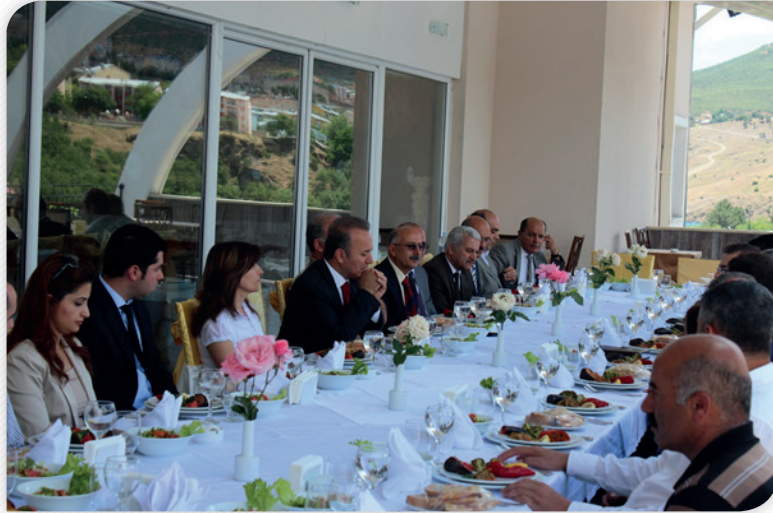
Kalkınma Kurulu Bölge Planı İstişare Toplantısı – 11 Haziran 2013, TUNCELI

11 Haziran 2013 tarihinde Tunceli Şaroğlu Otel'de gerçekleştirilen Kalkınma Kurulu İstişare Toplantısına, Kalkınma Kurulu Tunceli üyelerinin yanı sıra Kalkınma Ajansı Yönetim Kurulu Üyelerinden Tunceli Valisi Hakan Yusuf Güner, Tunceli Belediye Başkanı Edibe Şahin de katılım sağlamışlardır. Toplantıda 2014-2023 TRB1 Bölge Planı Taslağı Tunceli ili özelinde değerlendirilmiştir.