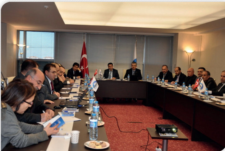
"Bölgede Sivil Toplum ve Sosyal Girişimcilik" Çalıştayı – 29 Aralık 2011, MALATYA

Kalkınma Kurulu Sosyal Komisyonu üyeleri tarafından 29 Aralık 2011 tarihinde Malatya'da gerçekleştirilen bir çalıştayda "Bölgede Sivil Toplum ve Sosyal Girişimcilik" konusu gündeme taşınmıştır.