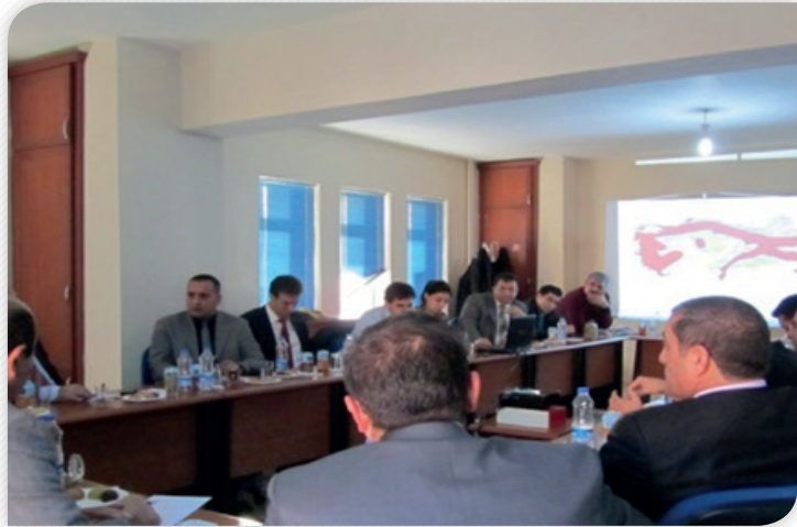
"Bölgenin Depremselliği ve Alınacak Tedbirler" Çalıştayı – 1 Aralık 2011, BİNGÖL

Kalkınma Kurulu Sosyal Komisyonu üyeleri tarafından 29 Aralık 2011 tarihinde Malatya'da gerçekleştirilen bir çalıştayda "Bölgede Sivil Toplum ve Sosyal Girişimcilik" konusu gündeme taşınmıştır.