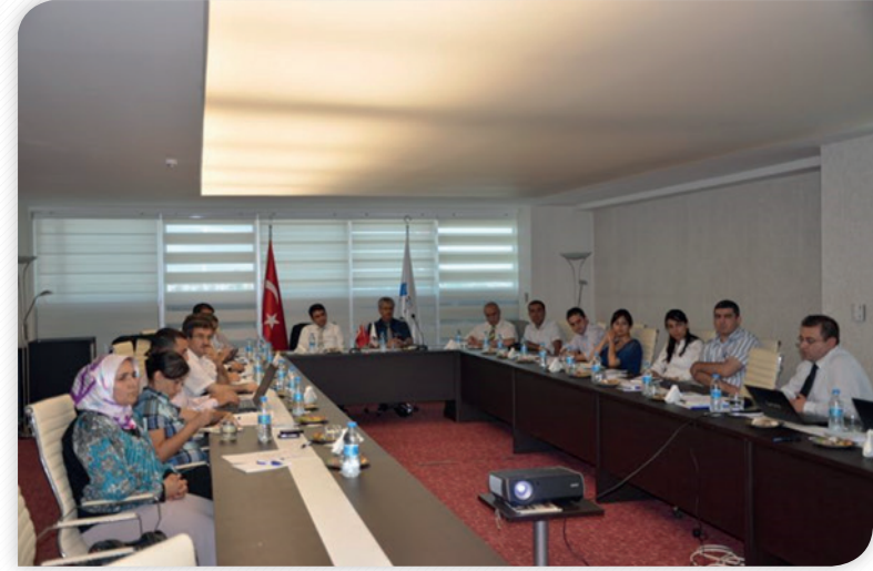
"Bölgenin Sanayi Altyapısı ve Gelişim Potansiyeli" Çalıştayı - 19 Temmuz 2012, MALATYA

Yine Kalkınma Kurulu Tarım Komisyonu üyeleri ve diğer ilgililerin katılımıyla 4 Temmuz'da Bingölde gerçekleştirilen bir çalıştayda "TRB1 Bitkisel Üretim Sektörü Stratejisi ve Eylem Planı" nı değerlendirilmiş ve ajans tarafından hazırlanacak bölge raporunda yer alması gereken öncelikler, stratejiler, tedbirler ve uygulamalar hakkında görüş ve düşünceler ortaya konulmuştur.