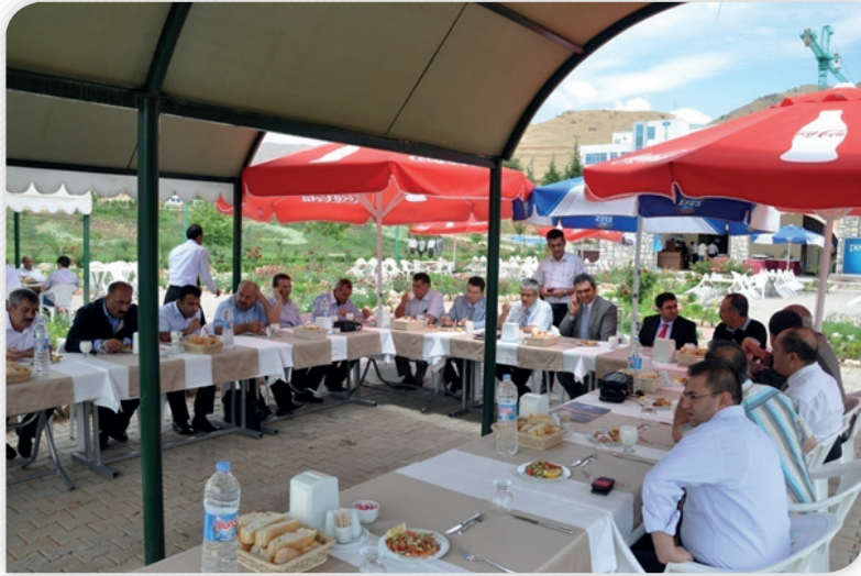
"TRB1 Bölgesi Sürdürülebilir Turizm Stratejisi ve Eylem Planı" Çalıştayı – 3 Temmuz 2012, TUNCELİ

19 Temmuz'da Malatya'da Kalkınma Kurulu Sanayi ve Ticaret Komisyonu üyeleri ve diğer ilgililerin katılımıyla "Bölgenin Sanayi Altyapısı ve Gelişim Potansiyeli" temalı başka bir çalıştay gerçekleştirilmiştir.